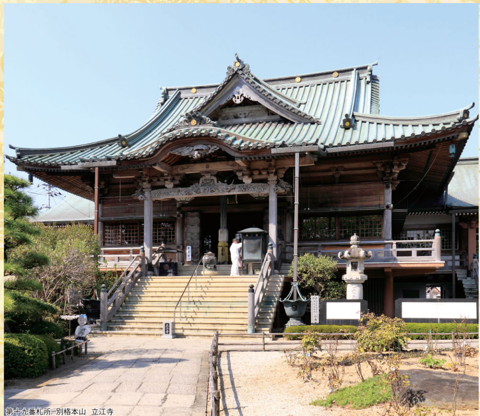
第十九番札所 別格本山 立江寺